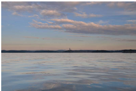
morje kot olje, v ozadju Rovinj