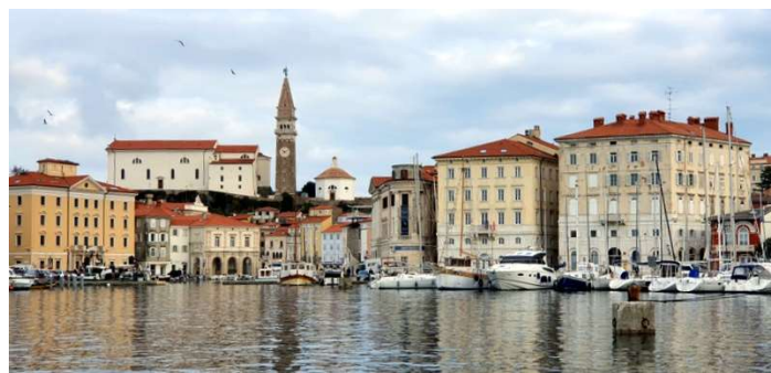
od mesta Rodos pa do Izole je Mala prevozila 1.158Nm z veliko počivanja :) ;; V Piranu sva prišla ob plimi, menda nekaj dni nazaj bil trg poplavljen