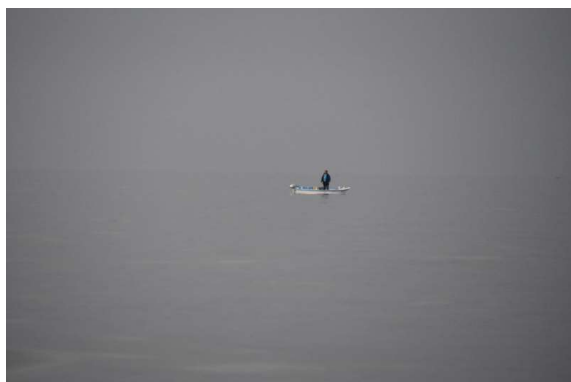
pa smo stopili v december in temu primerno tudi vreme: mraz, oblačno, slaba vidljivost ... ribiča brez luči pozno popoldne sploh ne opaziš

Glavna tema danes je, kako dati barko na suho in biti hkrati v karanteni. In pojejo telefoni. Ampak. Uradniki in policaji tega ne vedo. Predlagajo, naj pokličeva višje instance. Ah, ja... Birokrati pač ne razmišljajo, oni delajo tako, kot piše. In ker tega, kako dati barko na kopno v karanteni, ne piše, pač ne vedo. Simpl. Da se izogneva vsem tem kolobocijam, se odločiva, da se testirava in potem nimava karantene. To pa uradniki razumejo, hvala bogu. V Poreču se da testirati. Na napotnico. Samoplačniško ne. Da se pa v Puli. Samoplačniško. Vendar, Pula je že mimo, tja se ne misliva vračati. Kavelj 22. Dovolj za danes, jutri nadaljujewa. Jutri bo slabo vreme in bo primeren čas za take zadeve.