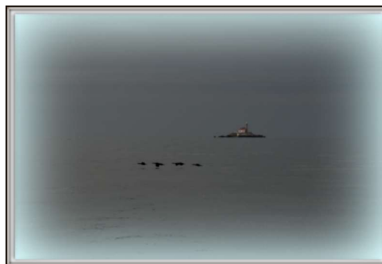
malo obdelana fotka svetilnik Sv.Ivana na majhnem otočku pred Rovinjem, zgrajen daljnega leta 1853. V sami zgradbi sta dva apartmaja namenjena najemu