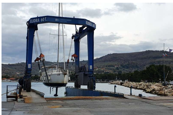
ne bo lahko Mali v Izoli, zeblo jo bo, pa še na suhem bo :(