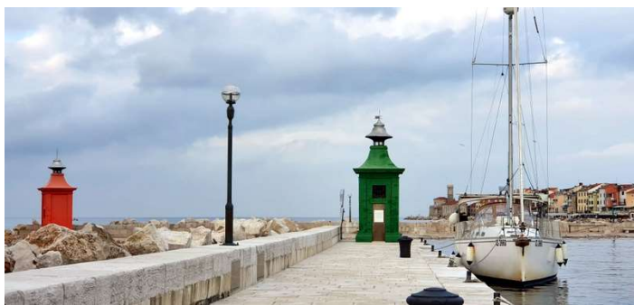
Mala po treh letih pristala spet v Sloveniji; moram pohvaliti mejnega policaja za vso prijaznost in trud !