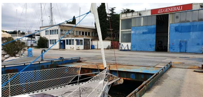
NMbazen ladjedelnice v Izoli in čaka na dvig