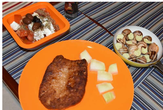
praznimo hladilnik, zmrzovalnik...